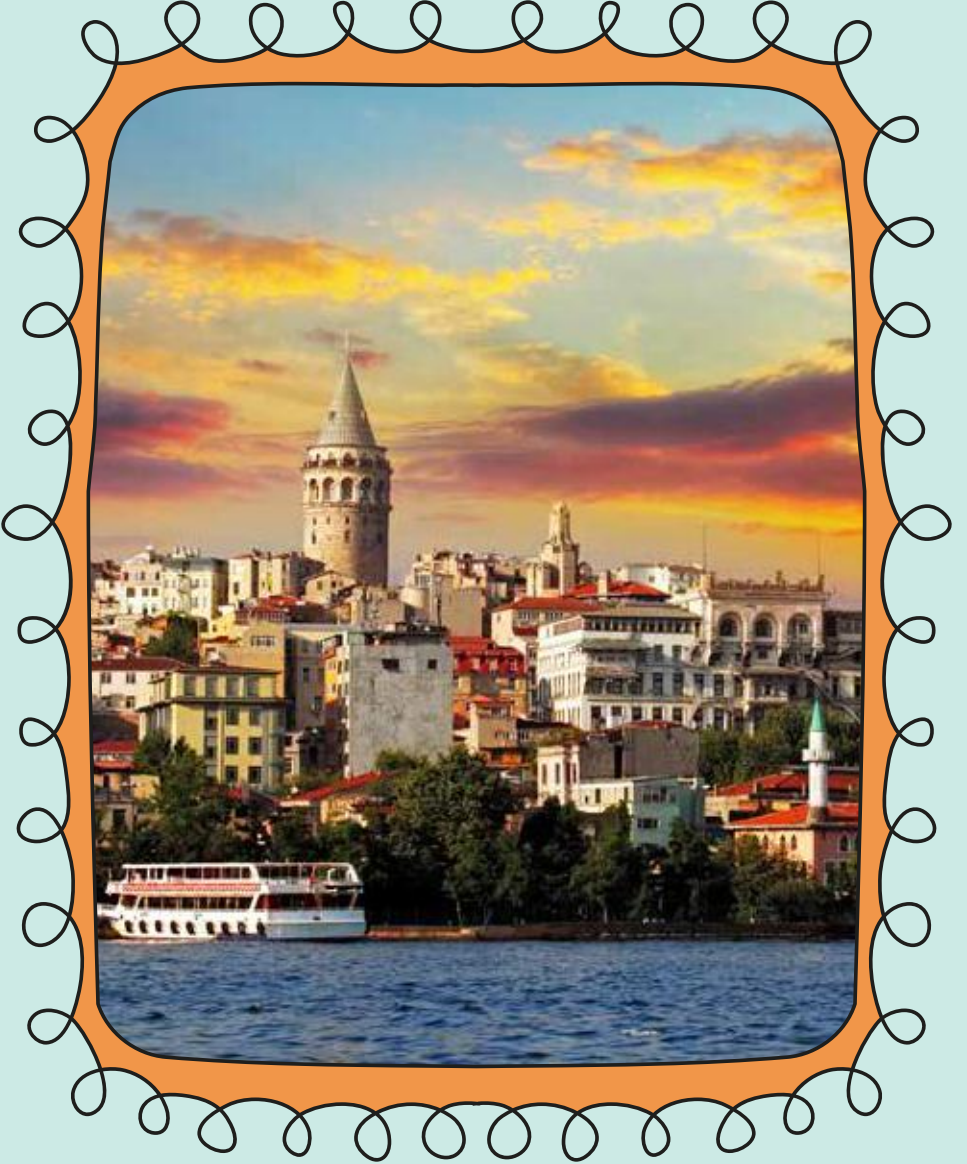
Gülsena YAVRU - 8/A