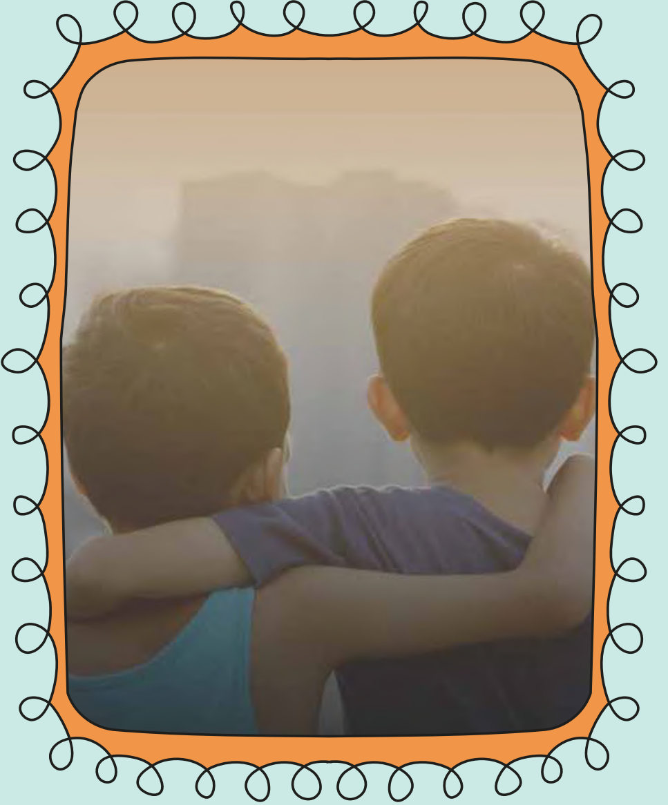
Merve DURKAL - 8/B